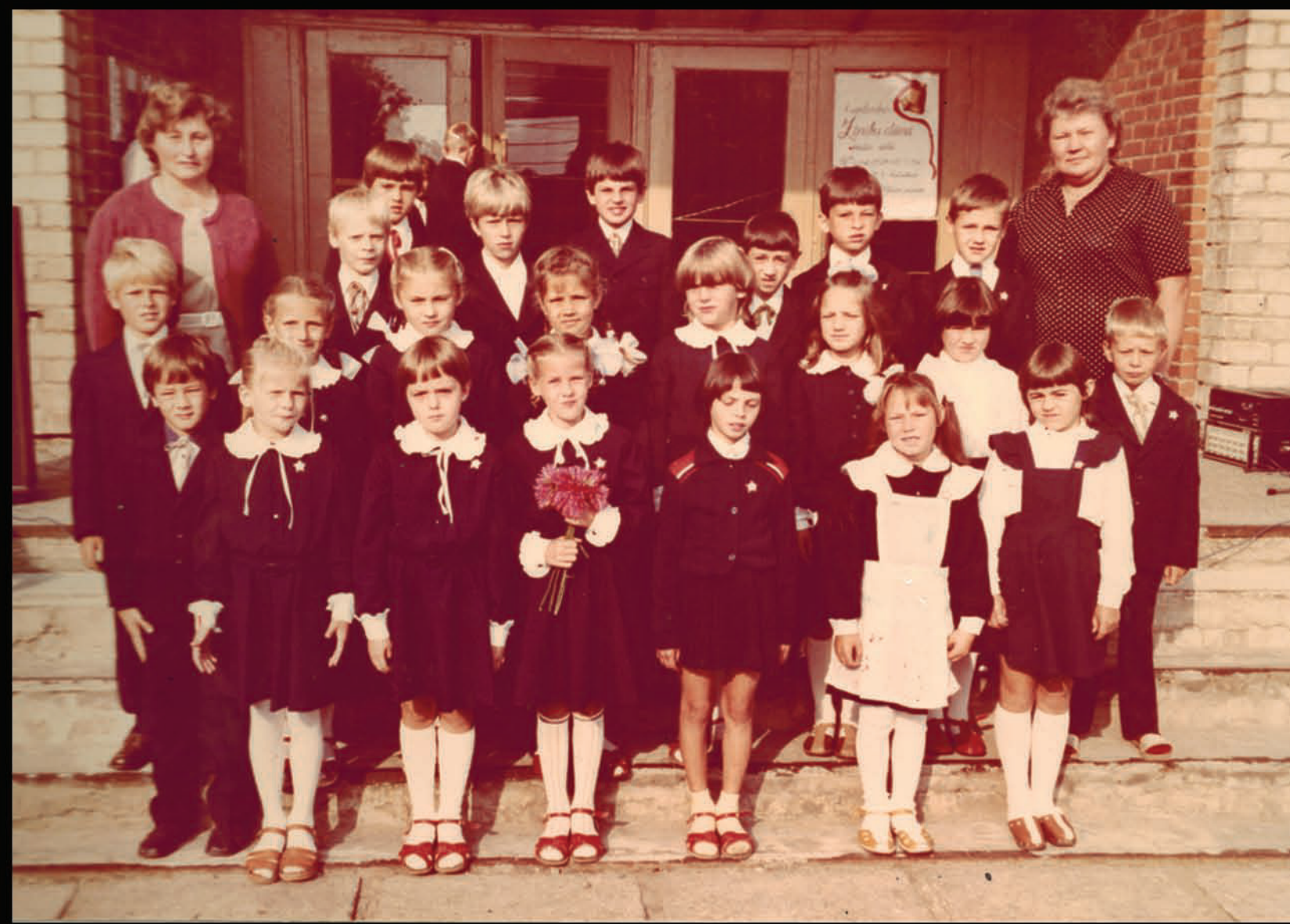
1. septembris, otrā klase. (MF priekšā skolotājai rozā jakā.)