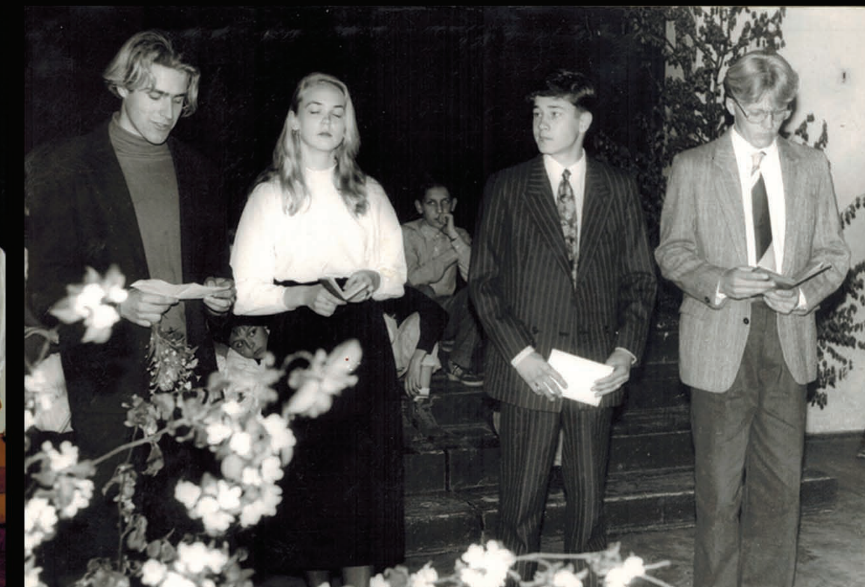
12. klase, pēdējais zvans. (MF pirmais no kreisās puses.)