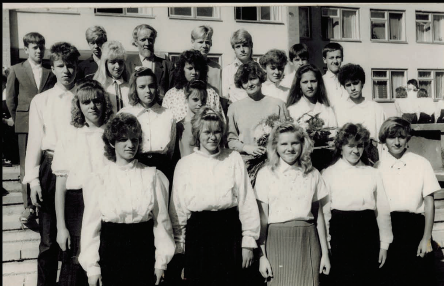
1. septembris, devītā klase. (MF pēdējā rindā, trešais no labās puses.)