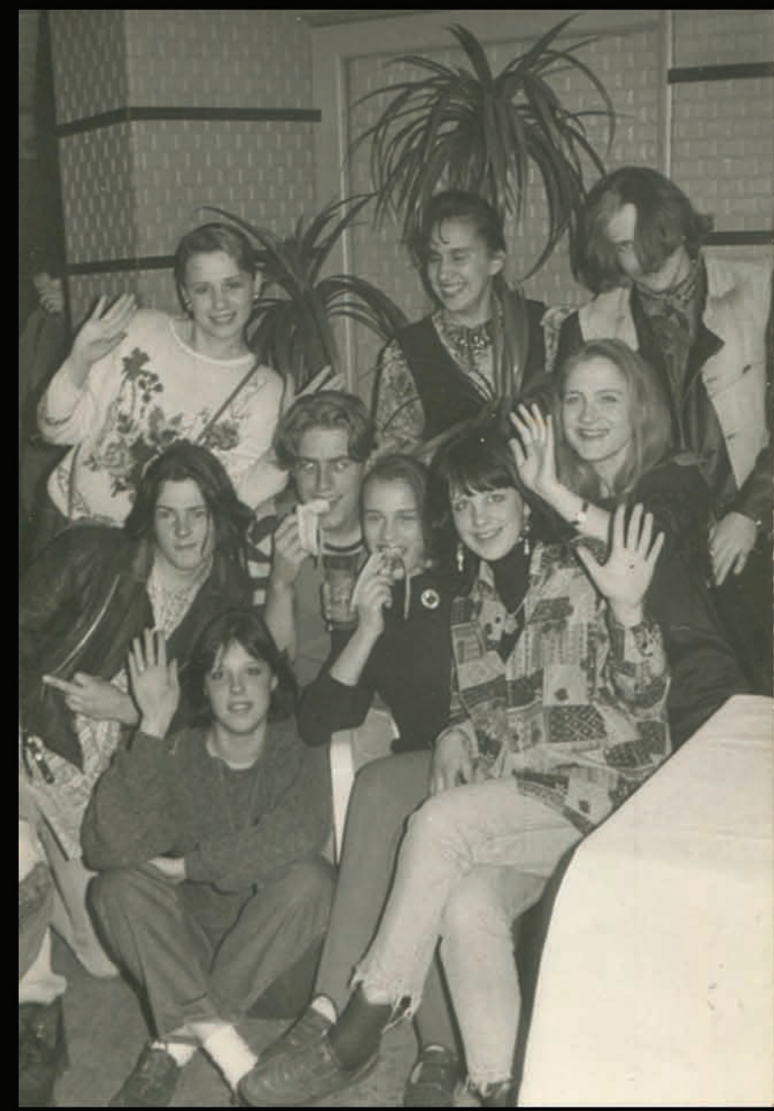
10.b klase Ziemassvētku ballē.