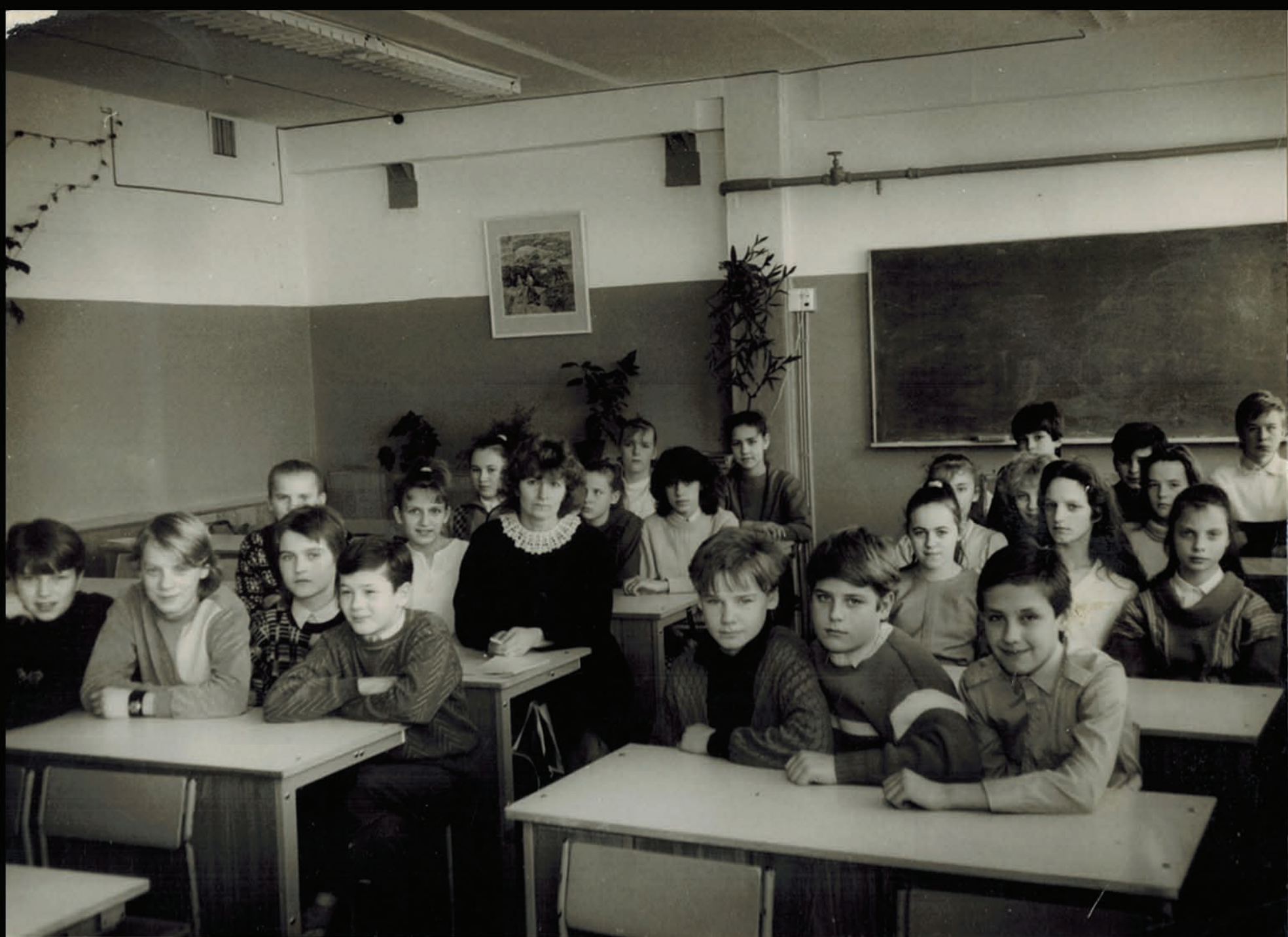
(MF pirmā rindā, otrais no labās puses.)