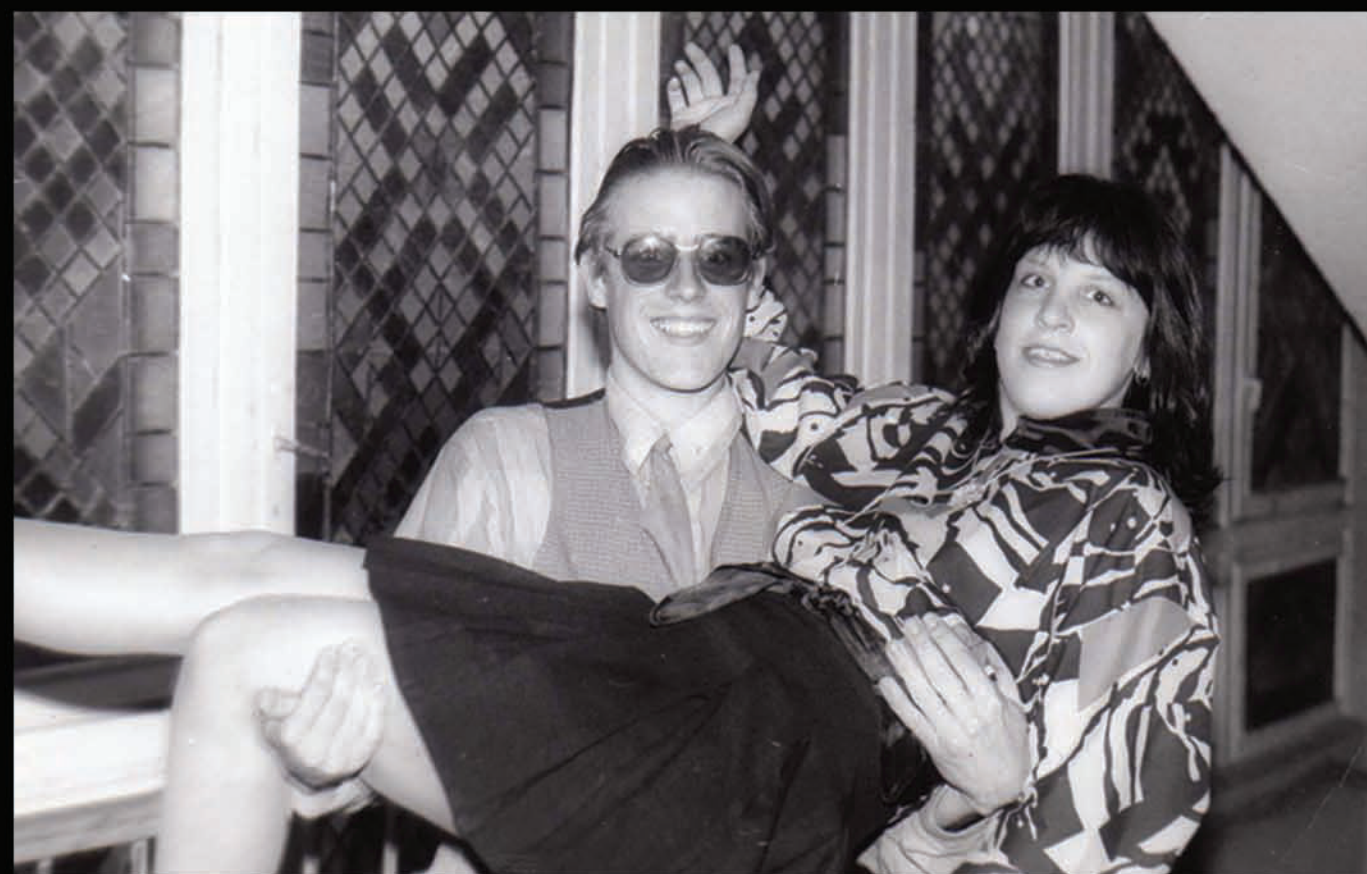
Aizputes vidusskolā, balles laikā. 11.klase 1993/1994 gads.