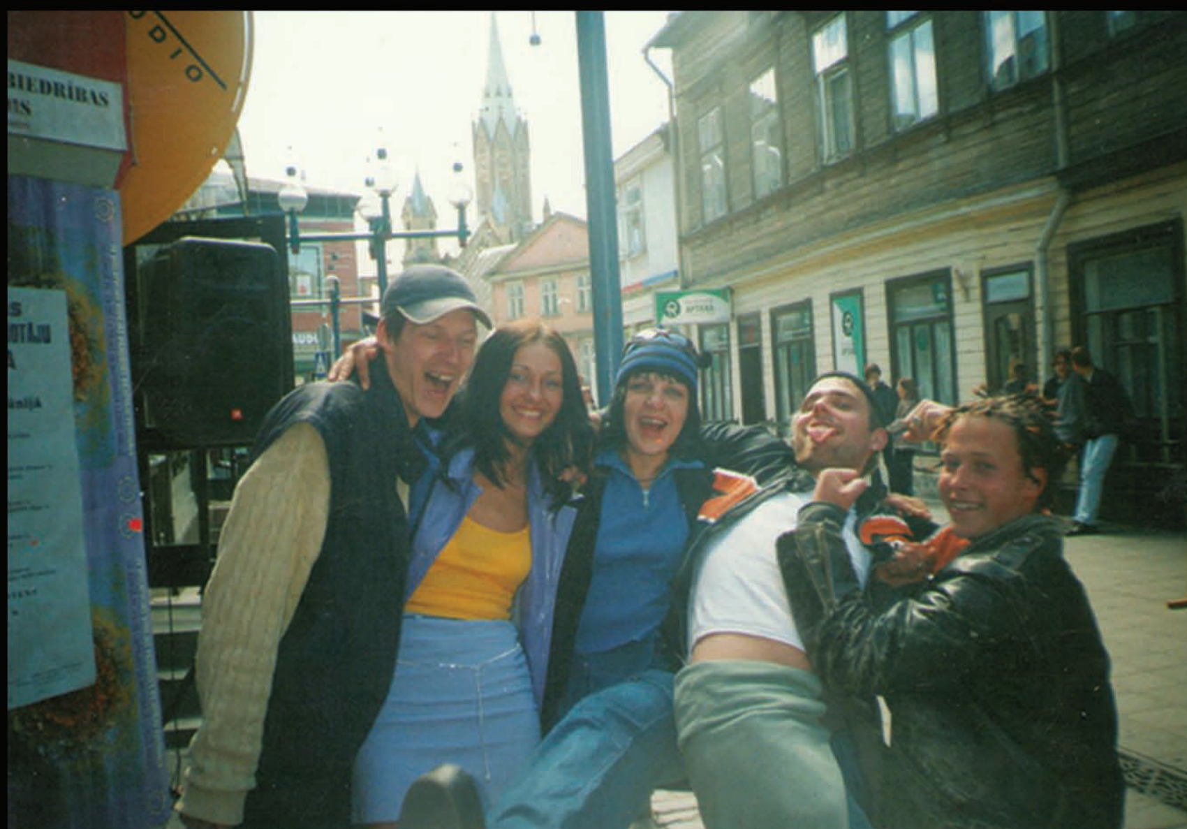
Grupās TUMSA albuma „Nesaprasto cilvēku zemē” prezentācijas tusiņš, Liepājā, Gājēju iela. 2001.gadā.