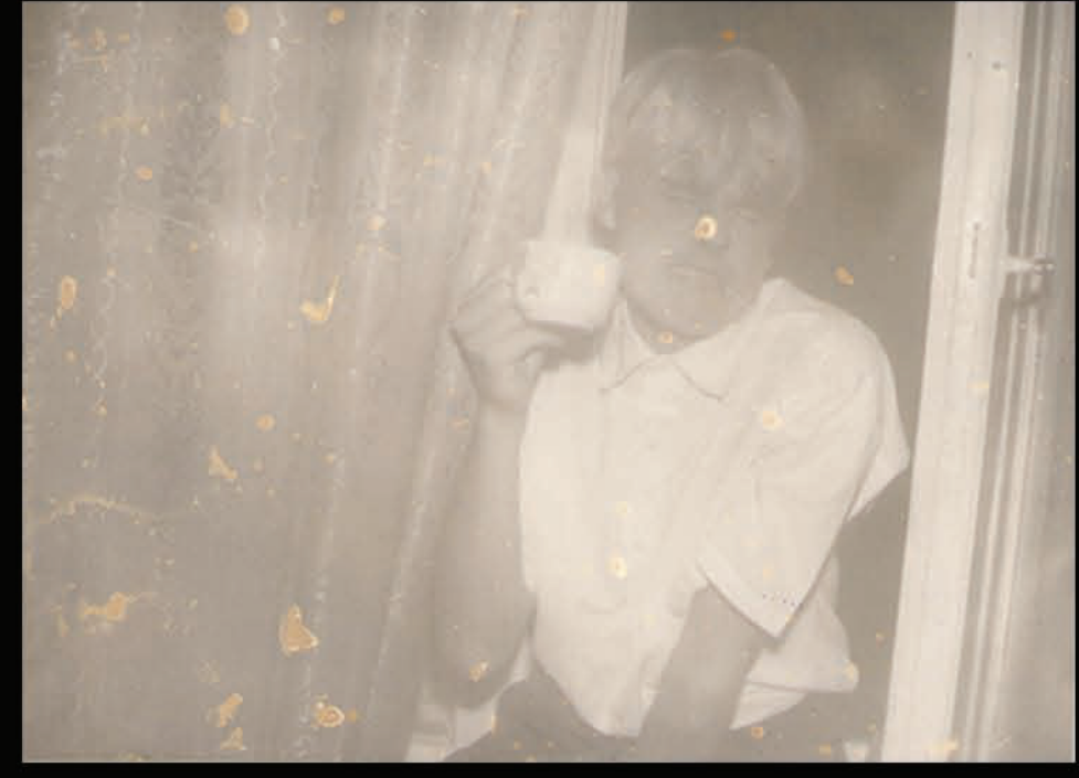
Sālsmaize pie Maijas dzīvoklī, Kuldīgas ielā 1992.gada septembris.