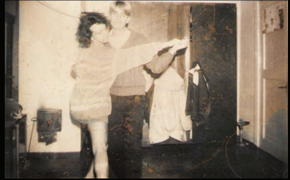
Aizputē, Kuldīgas ielā, pie Maijas dzīvoklī, kurā starp mēģinājumiem notika arī fotosesijas. Pie fotoaparāta - Ingars Gudermanis. 1992.gada rudens.