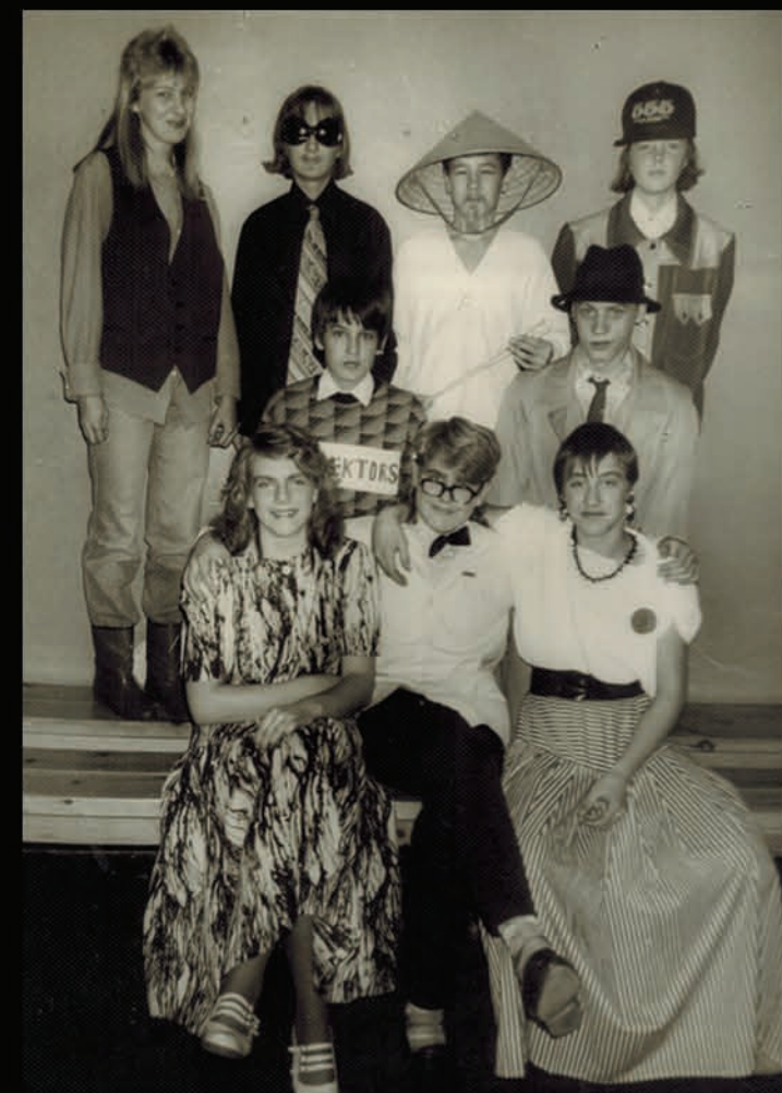
Devītā klase, karnevāls. "Virietis mīļēja sievieti". (MF pirmā rindā vidū.)