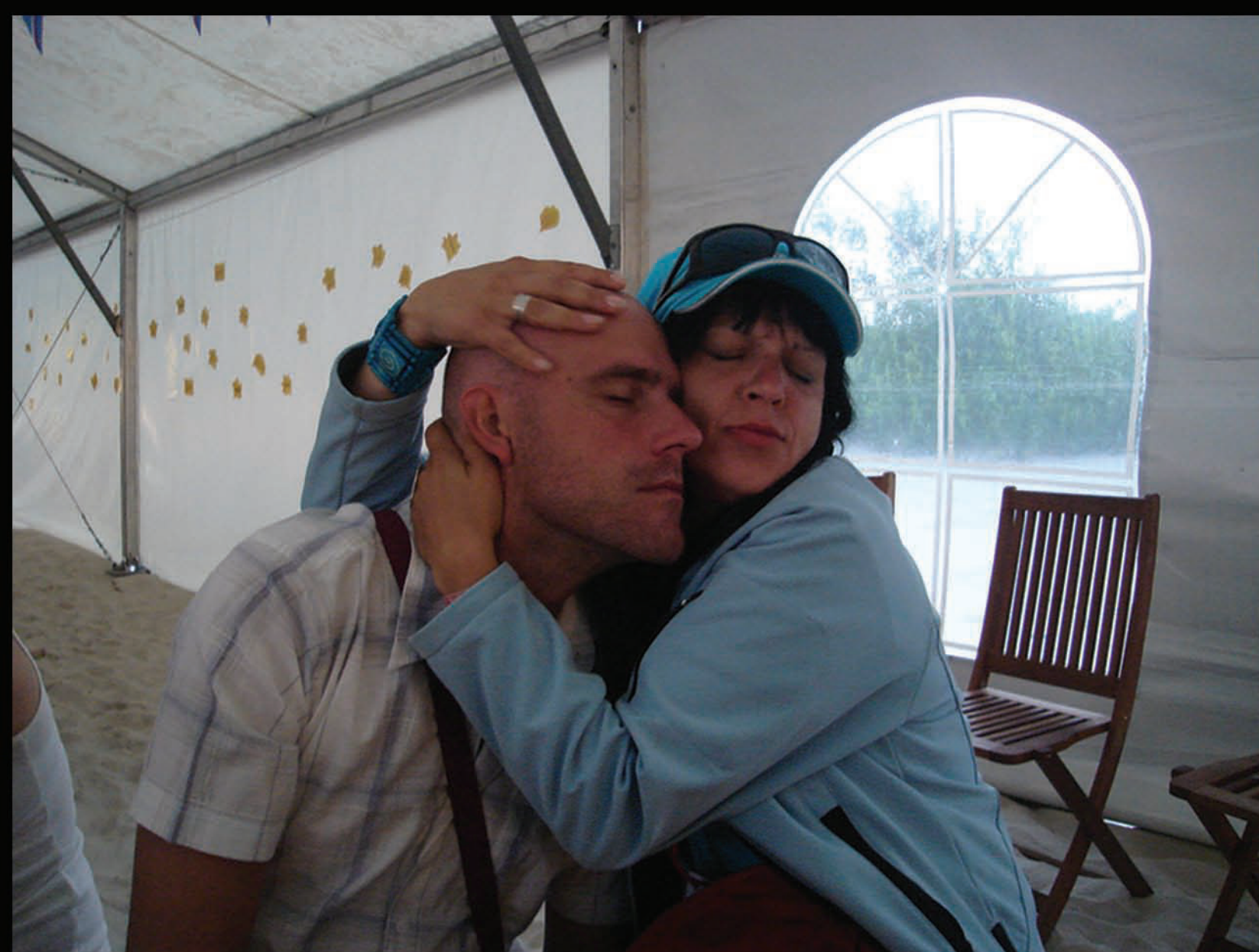
Festivāla „Baltic Beach Party” laikā ... 2007.gads.