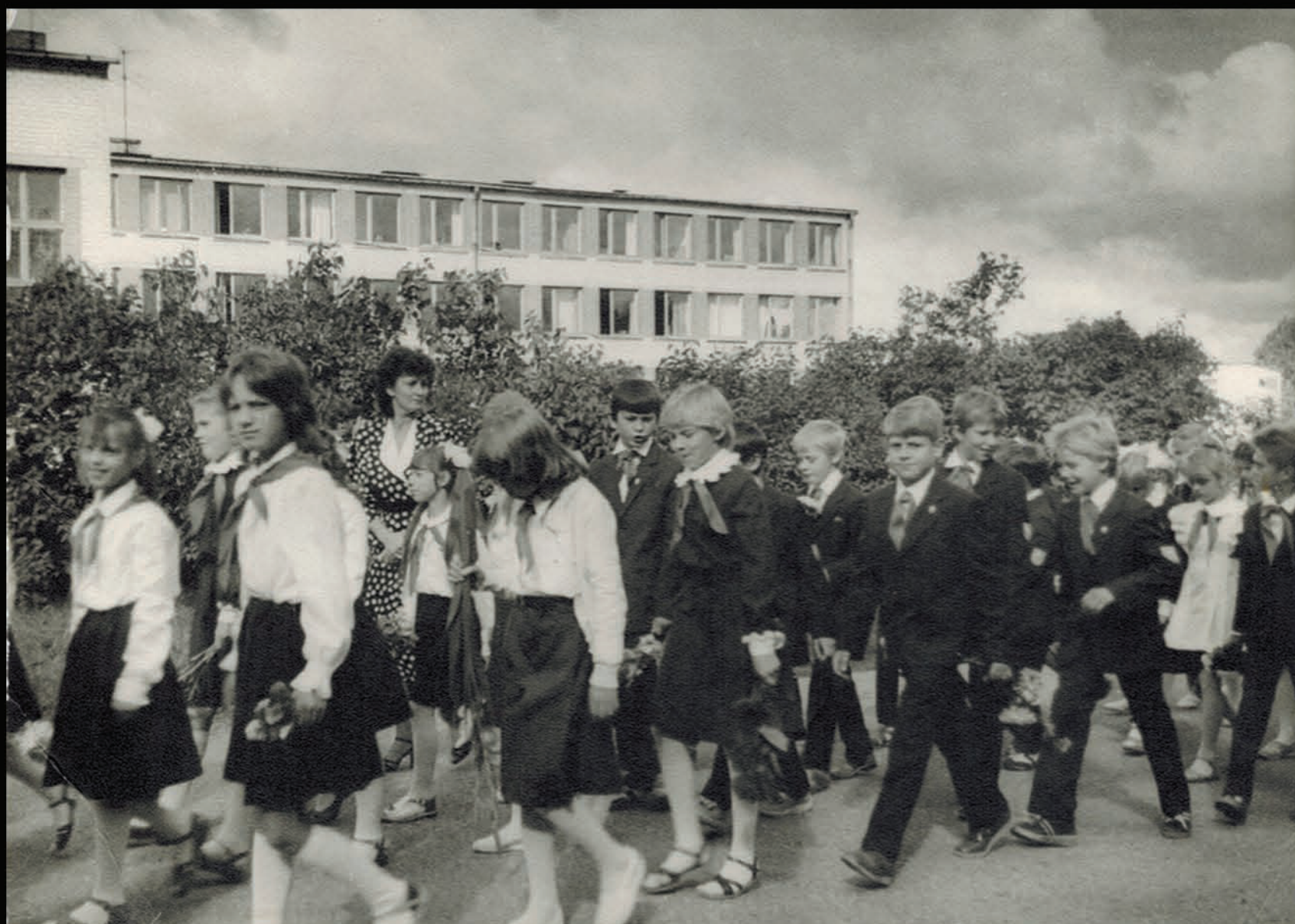
1. septembris, gājiens, piektā klase. (MF pirmā rindā, trešais no labās puses.)