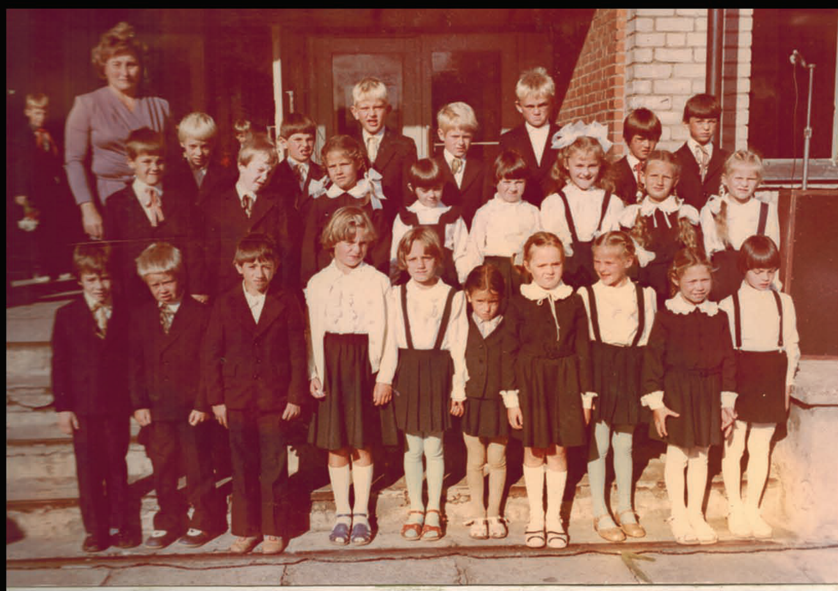
1. septembris, pirmā klase. (MF augšā, ceturtais no labās puses.)