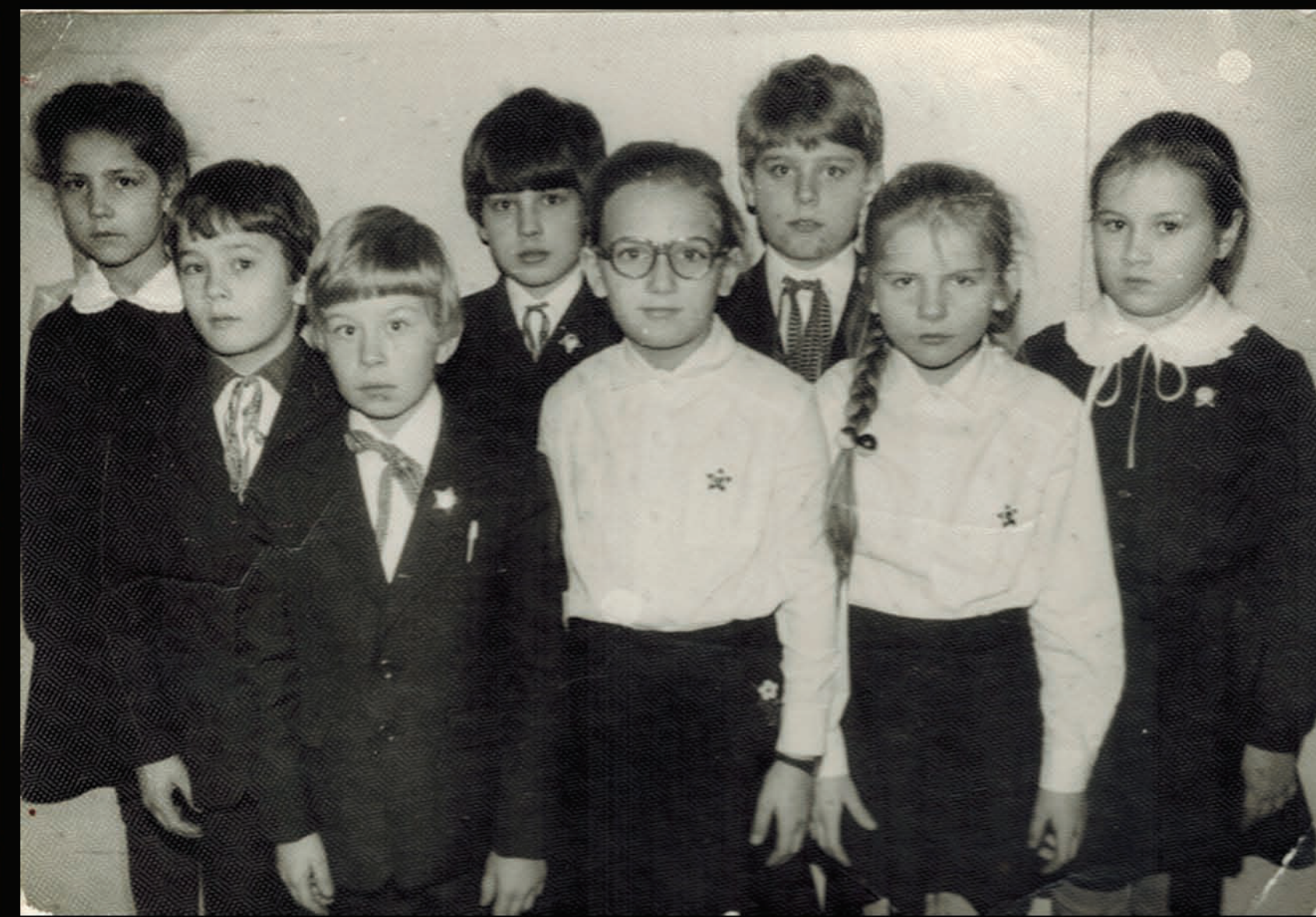
Trešā klase, pirmrindenieki. (MF trešais no labās puses.)