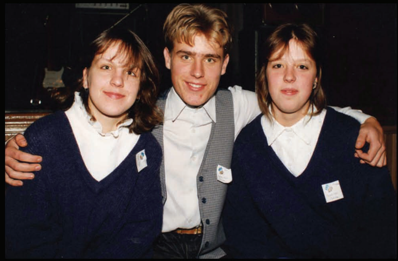
Grupa „Trisstūris”, piedaloties konkursā „Mana dziesmiņa”, Grobiņā. 1991.gads.