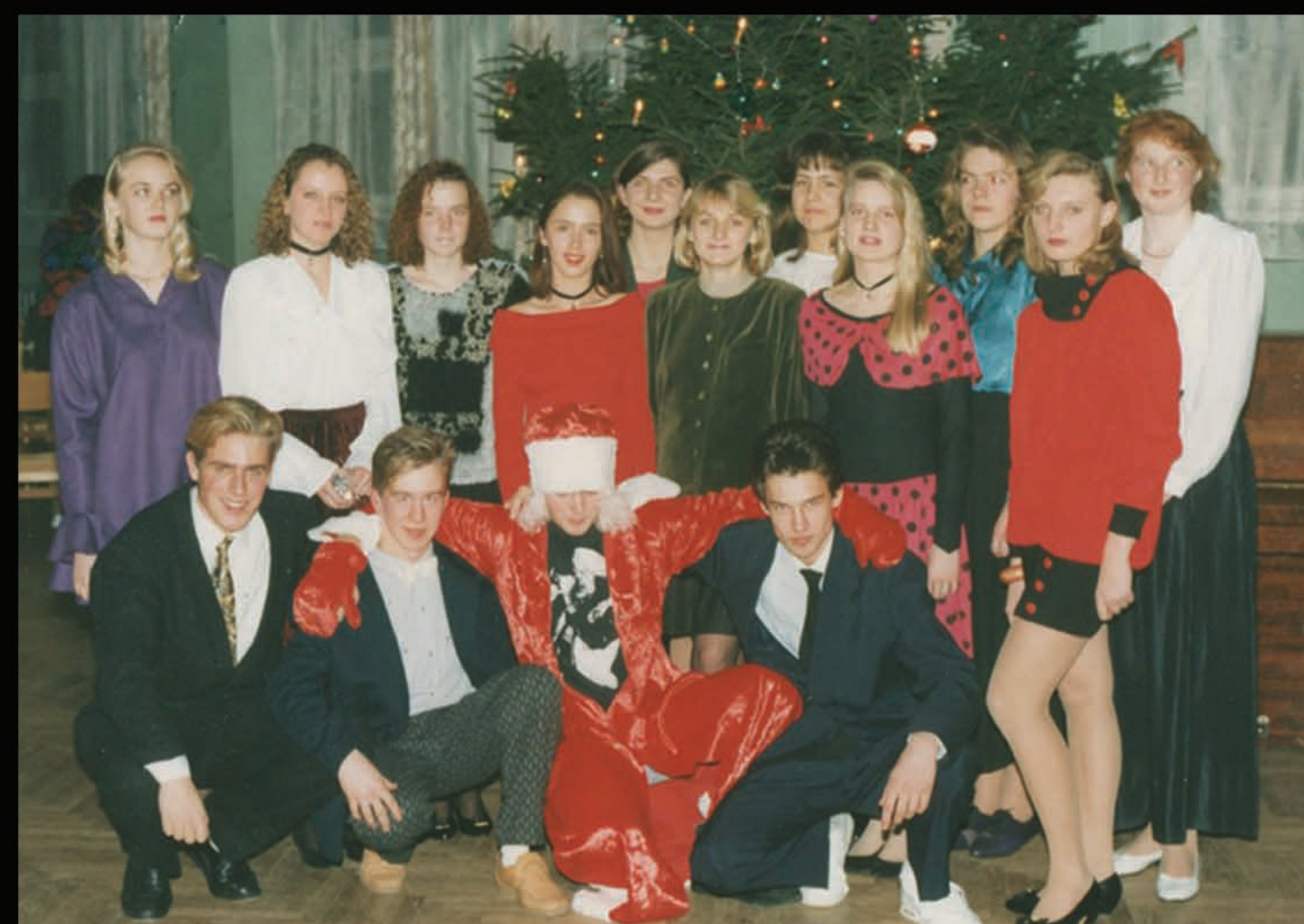
12.b klase Ziemassvētku ballē.