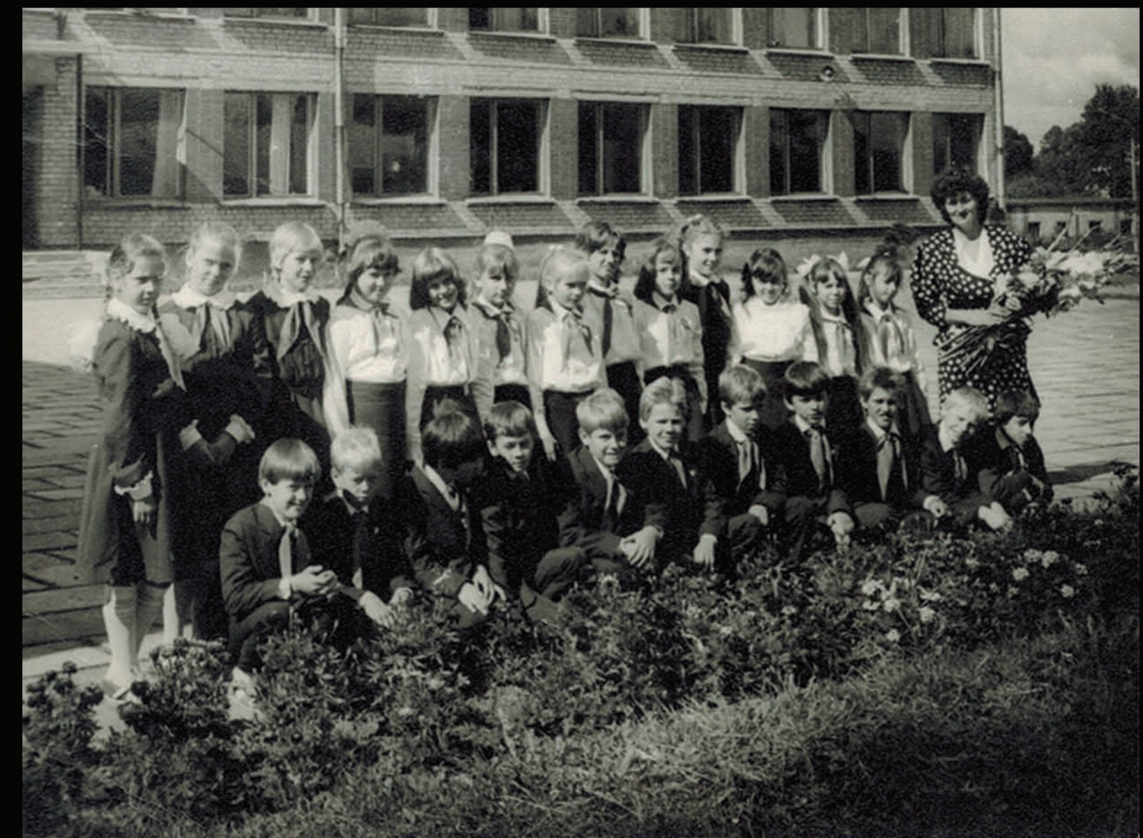
1. septembris, piektā klase. (MF pirmā rindā, piektais no kreisās puses.)