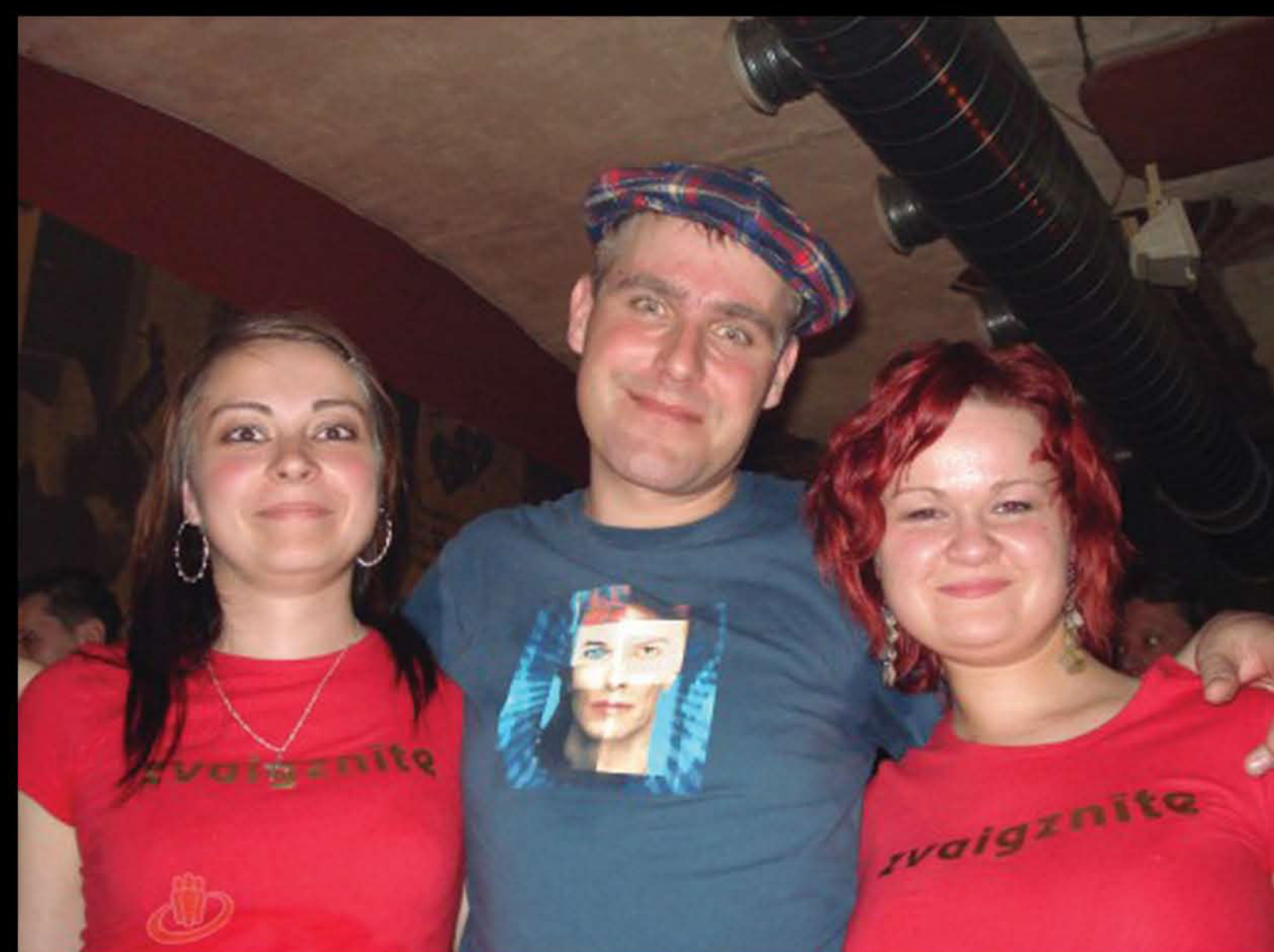
Gadus nepateikšu, vietas-Sarkans, Cēsis, Jūrmala, Četri Balti krekli. Daudz tika apmeklēti Tumsas koncerti, dažkārt ar fotoaparātu.