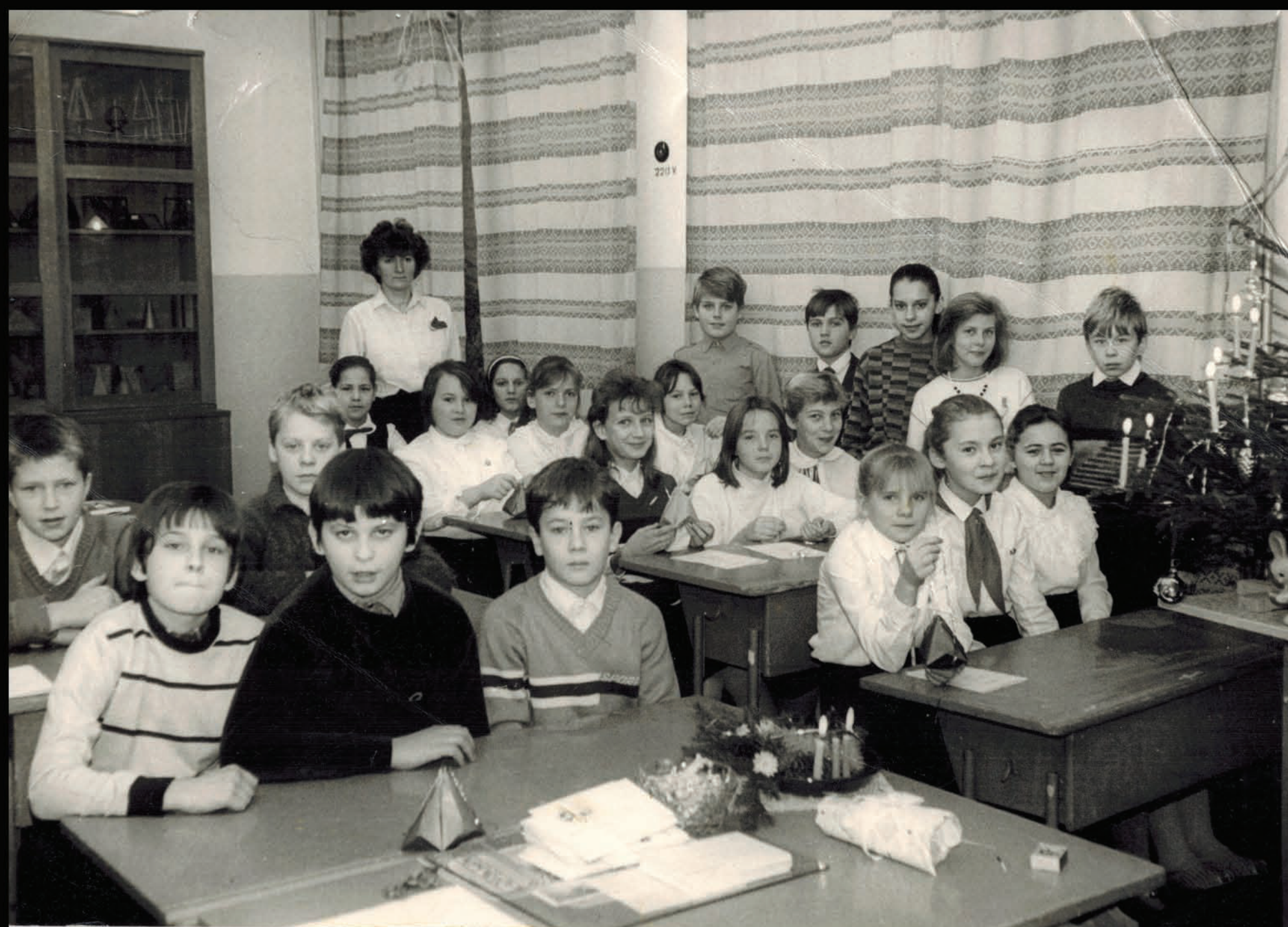
(MF stāvus rindā pie loga, pirmais no kreisās puses.)