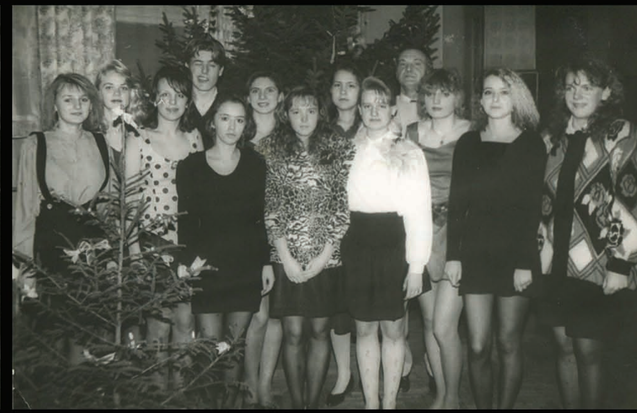
10.b klase Ziemassvētku ballē.