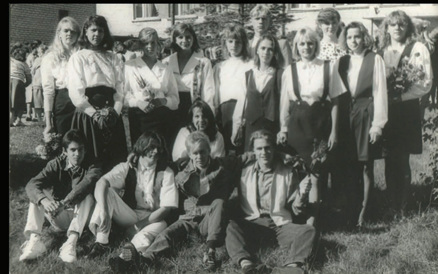
12.b klase 1.septembris - 1994 gads.