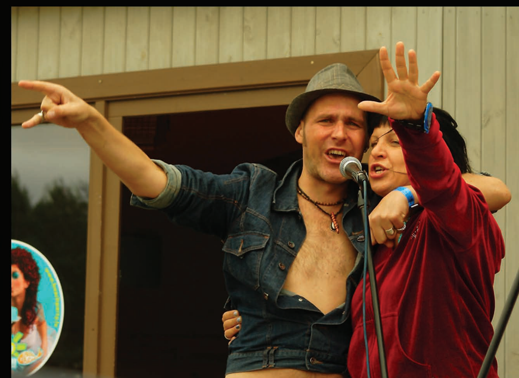
Festivāla „Baltic Beach Party” afterparty... Vērbēlnieki. 2010. gads.