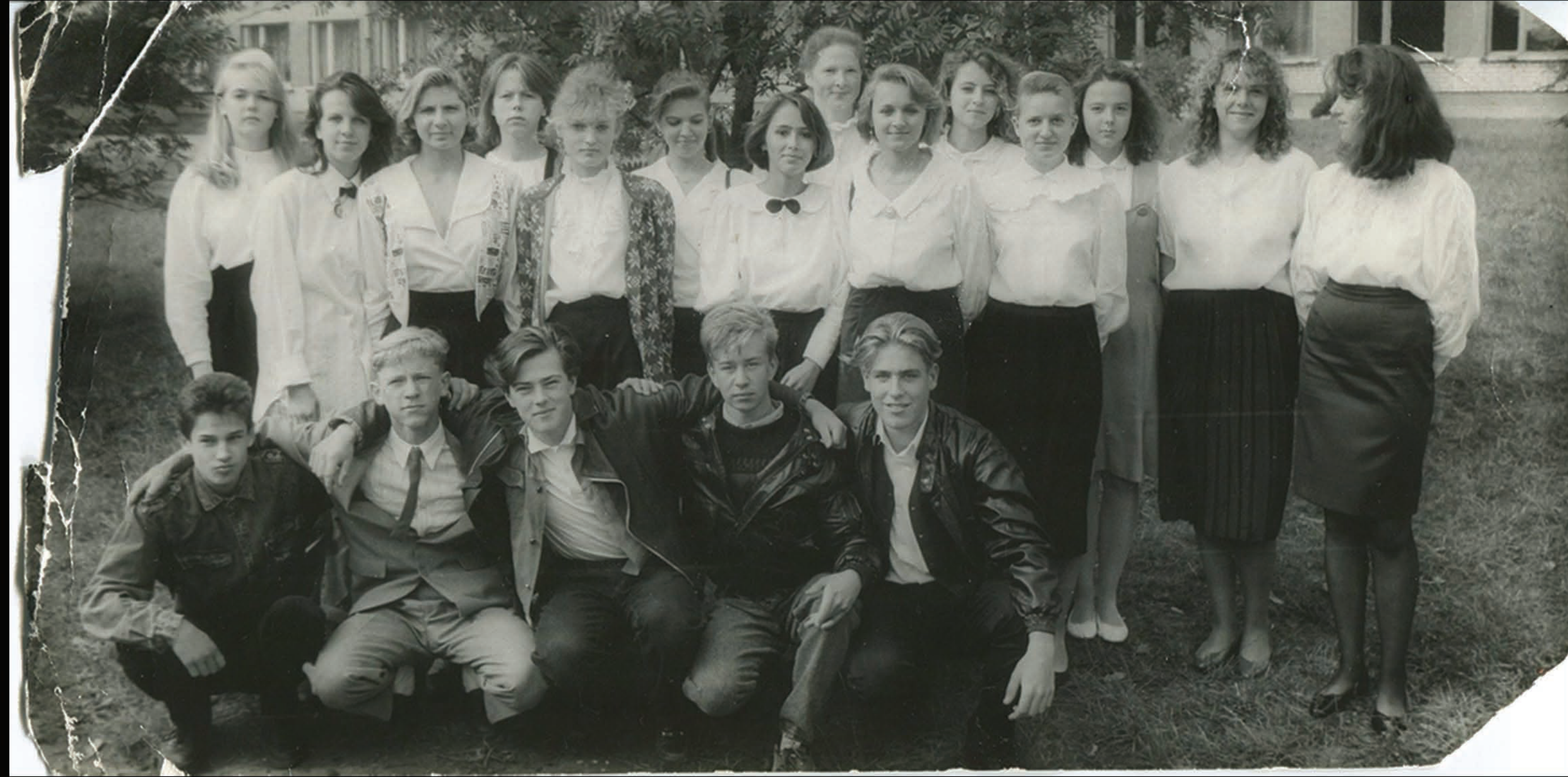
Aizputes vidusskolas 11.b klase 1.septembris 1993.