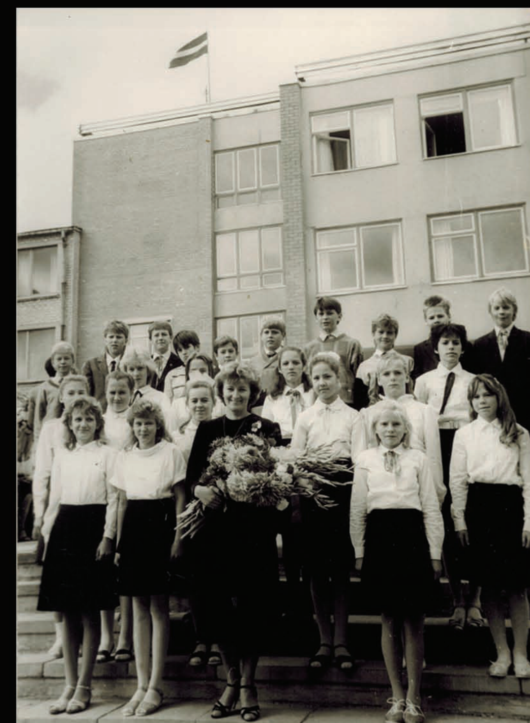
(MF pēdējā rindā, piektais no labās puses.)