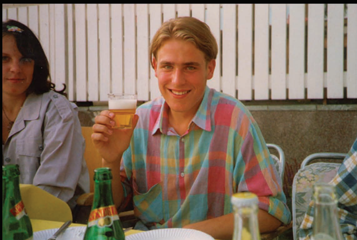
Zviedrijā, Kolmardenā. 1994. gads.