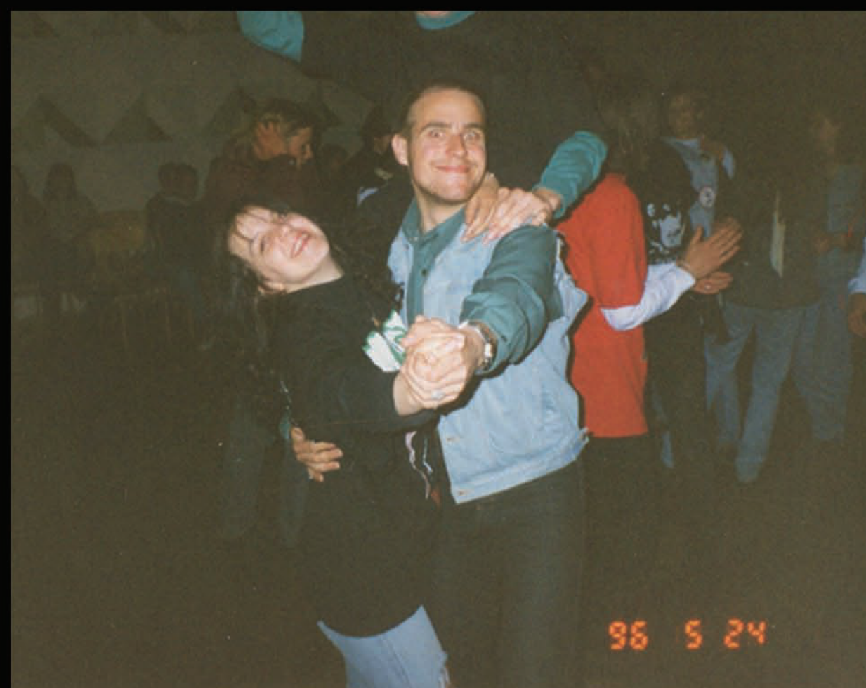
Apmeklējot skolas diseni - gadu pēc skolas beigšanas.