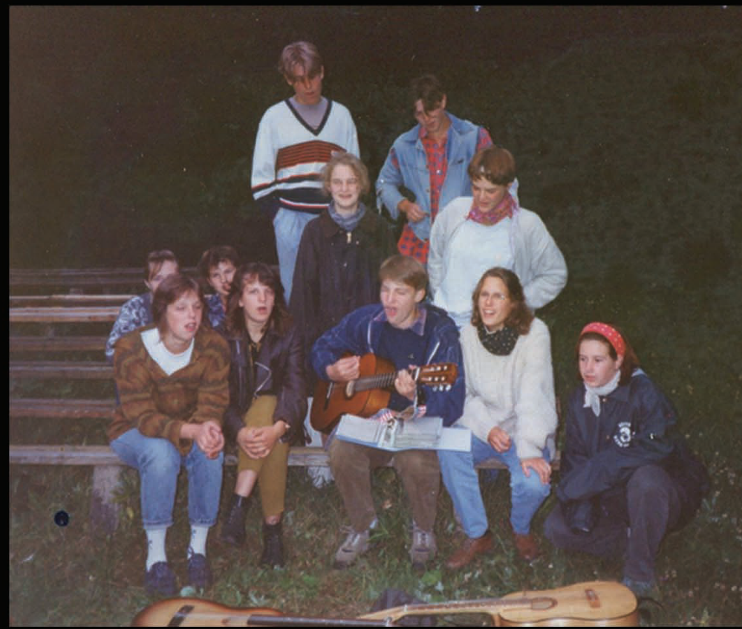
Uzņemot ciemos jauniešus no Aizputes sadraudzības pilsētas Vācijā (neatceros pilsētu) - Misinķalna estrādē - kopēja sadziedāšanās. 1993 gads.