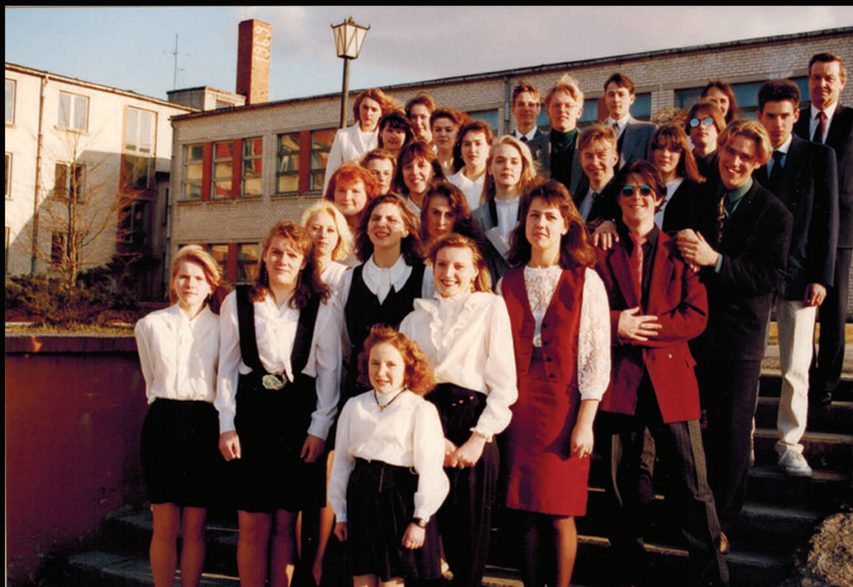
(MF trešais no labās puses.)