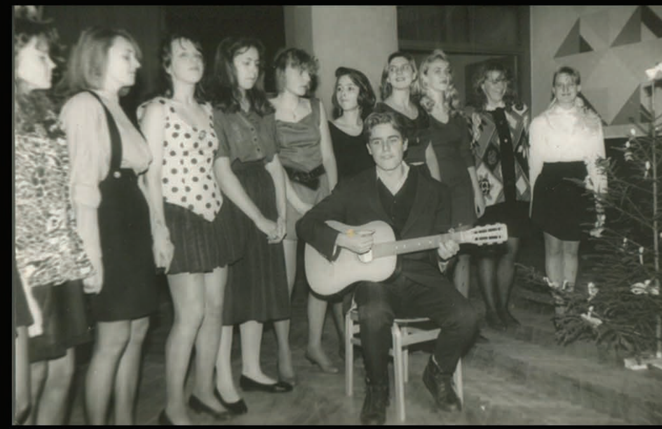
Ziemassvētku balles priekšnesums.10.b klase.