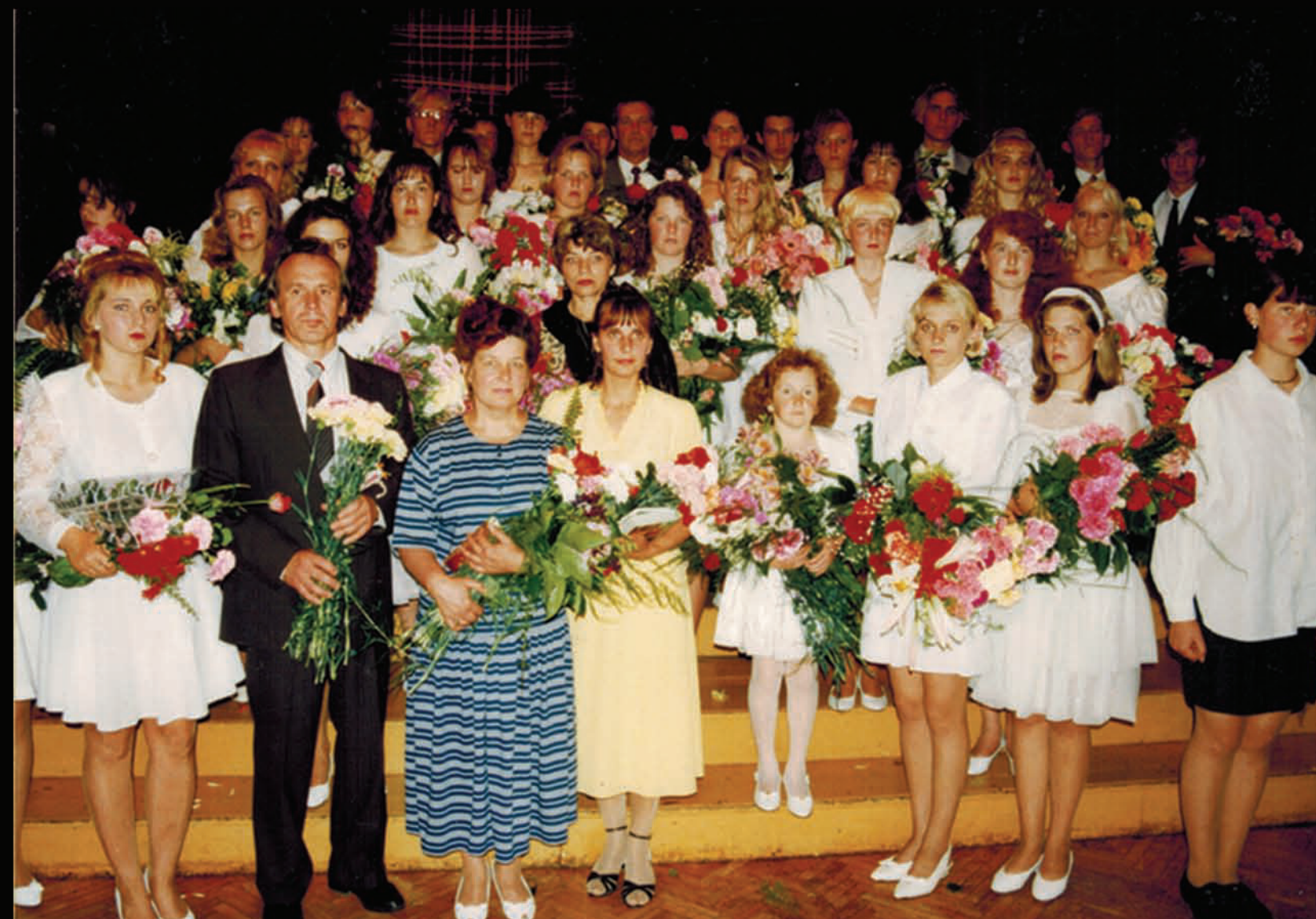
(MF aizmuģurē, labajā stūrī.)