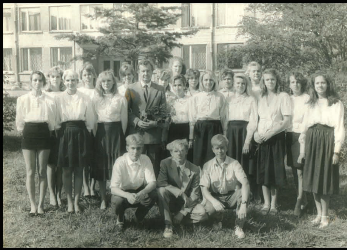
10.b klase - 1.spetmebris 1992.gads.