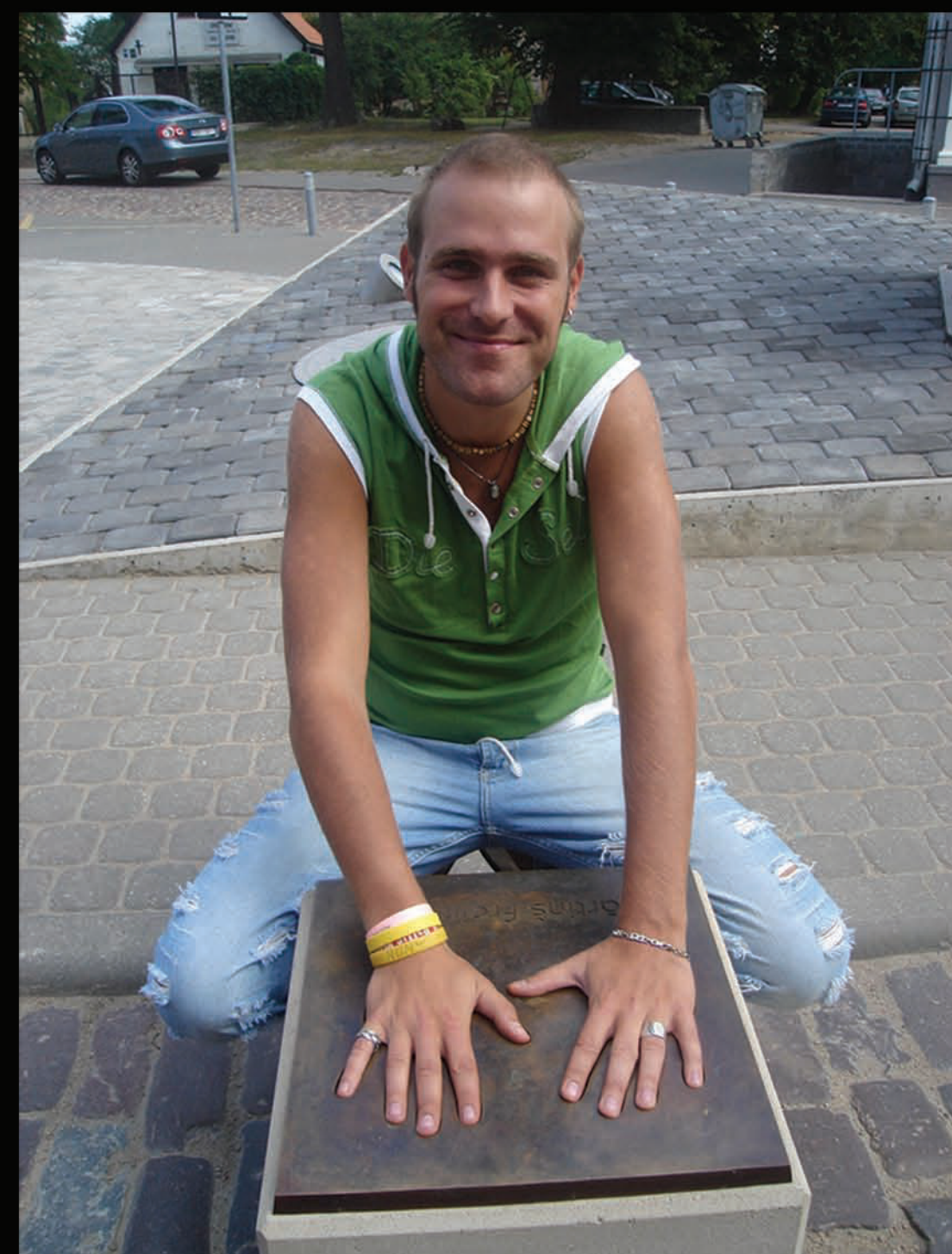
Piemērot savas plaukstas Latvijas mūziķu Slavas alejā, Liepājā.