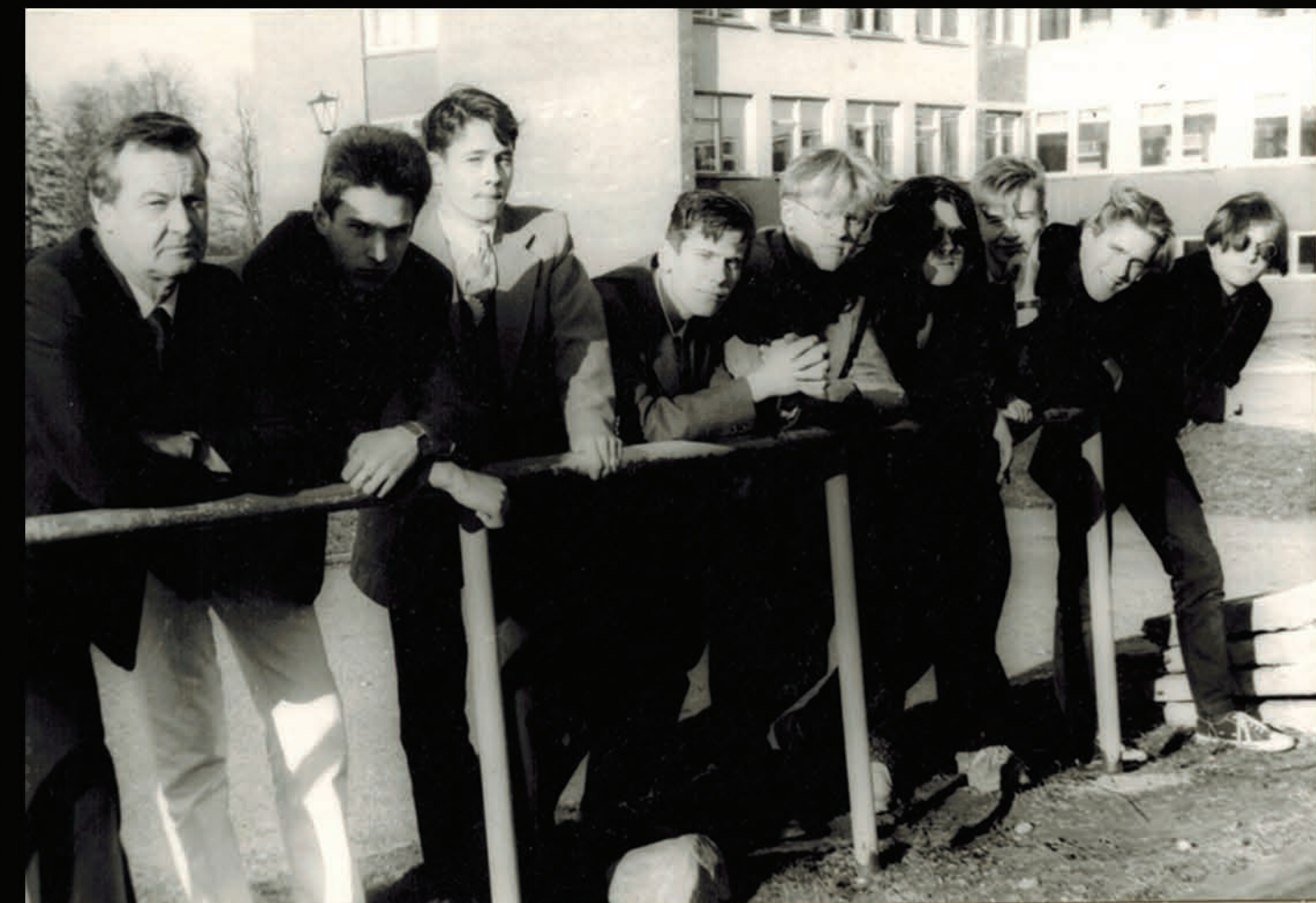
(MF otrais no labās puses.)