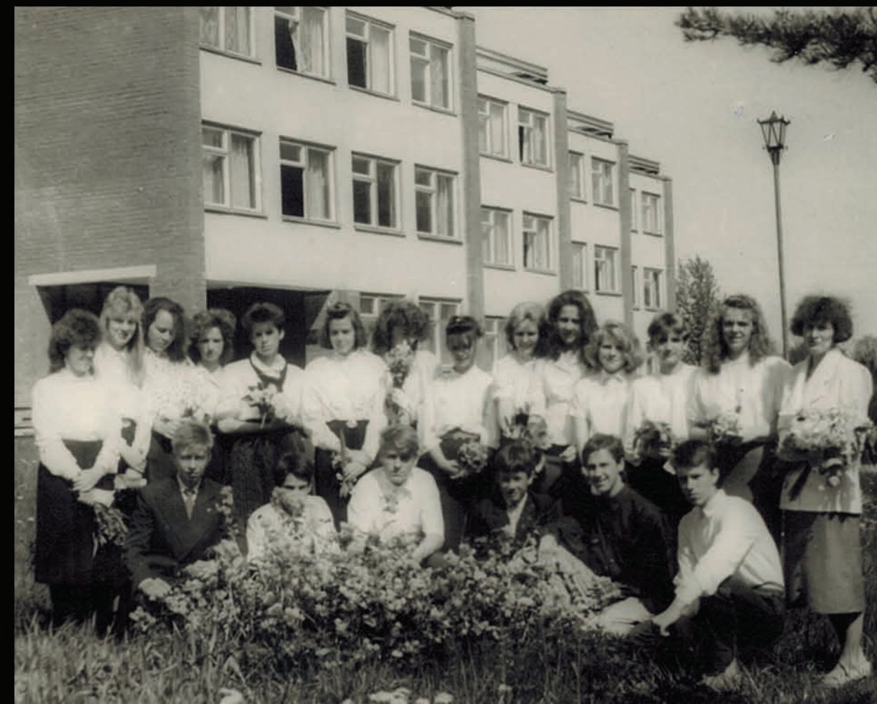
Devītā klase, pēdējais zvans. (MF pirmā rindā, trešais no kreisās puses.)