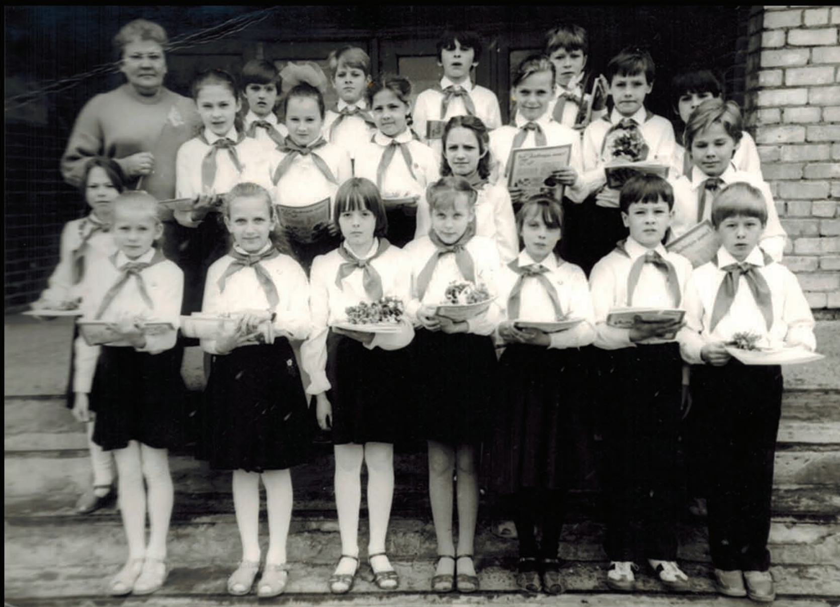
Ceturtdā klase, uzņemšana pionieros. (MF pēdējā rindā otrais no kreisās puses.)