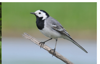
Baltā cielava / Motacilla alba