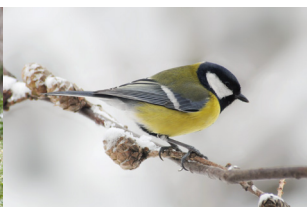
Liela zilīte / Parus major