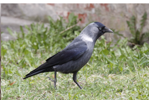
Kovārnis / Corvus monedula